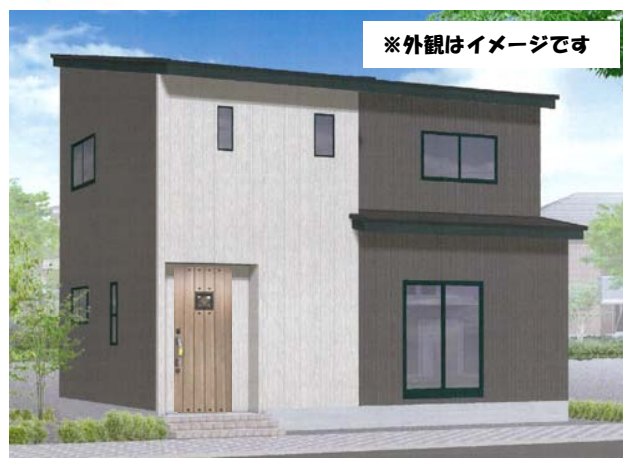
※外観はイメージです