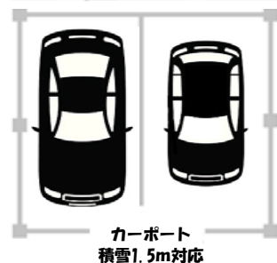
カーポート 積雪1.5m対応